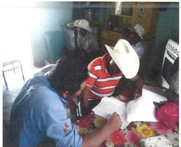
Integración de Comité de vigilancia de NCPE El Cedral, Sierra Mojada, Coahuila