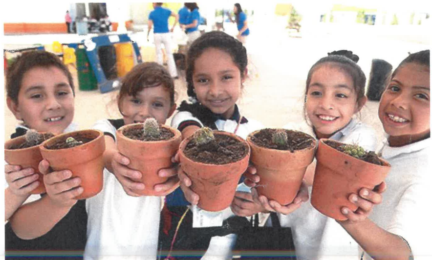
Rally ecológico en Saltillo, México.

El día mundial del medio ambiente se celebra el 05 de junio de cada año y es una de las principales herramientas de las Naciones Unidas para impulsar la sensibilización y acción en pro del medio ambiente a nivel global, mediante la participación de más de 100 países.