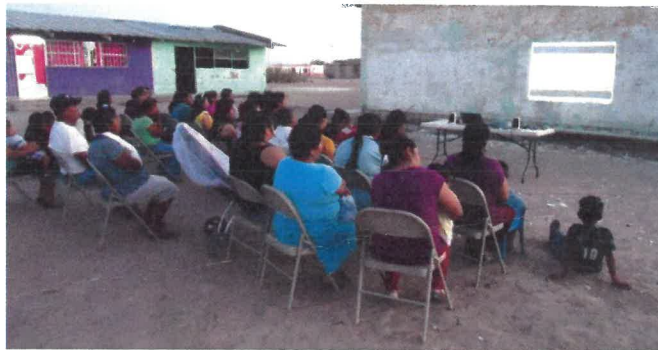
Proyección de la serie "Faros de esperanza" en el ejido Laguna de Palomas.

En el ejido Laguna de Palomas se presentó una serie de videos a las amas de casa, niños y productores de sal para conmemorar el día mundial del medio ambiente. En la serie conocida como "Faros de Esperanza" se pueden apreciar los recursos de las ANP de Cuatrociénegas, Cañón de Santa Elena, Maderas del Carmen, Cumbres de Monterrey y Mapimí.