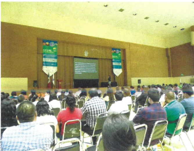
Participación de los asistentes de biodiversa 2014 en el taller “Ecotecnias” (Derecha).

En el marco del día mundial del medio ambiente, Biodiversa funge como un espacio para la reflexión y debate de la conservación de la biodiversidad, y de su papel en el desarrollo sostenible de la región. En su décimo segunda edición “Alza tu voz, no el nivel del mar”, se puntualizó en temas concernientes al calentamiento global y sus efectos en la biodiversidad, Áreas Naturales Protegidas, así como en proyectos de investigación y conservación de la biodiversidad en distintos sitios.