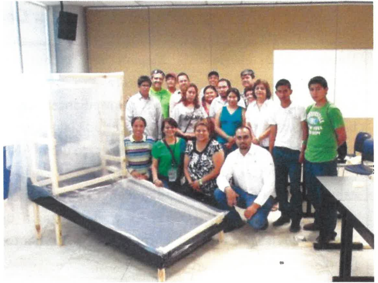
Participación de los asistentes de biodiversa 2014 en el taller "Ecotecnias".

Se contó con la asistencia de 534 personas incluyendo gente de las comunidades, amas de casa, docentes, investigadores, estudiantes, personalidades de los tres niveles de gobierno y de la población en general. Por parte de la RB Mapimí se contó con la participación de nueve habitantes (promotores/as y prestadores de servicios turísticos) y seis integrantes del personal de dicha ANP, quienes además de asistir a las conferencias impartidas se integraron en diversas mesas de trabajo y talleres enfocados al conocimiento de los recursos bióticos y abióticos, de su importancia y de