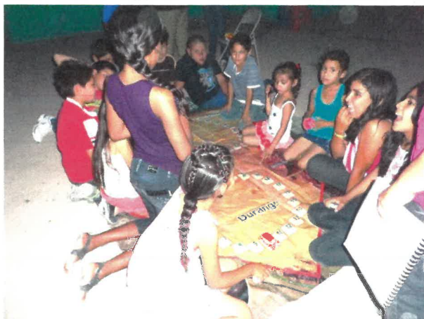
Desarrollo de la actividad: carrera por la conservación, llevada a cabo en el CCA "La Tortuga".

En el CCA "La Tortuga" se realizaron actividades de educación ambiental para fortalecer el conocimiento de la biodiversidad del Desierto Chihuahuense, así como de las actividades productivas que se llevan a cabo en la RB Mapimí y las consecuencias de hacerlas de forma desordenada.