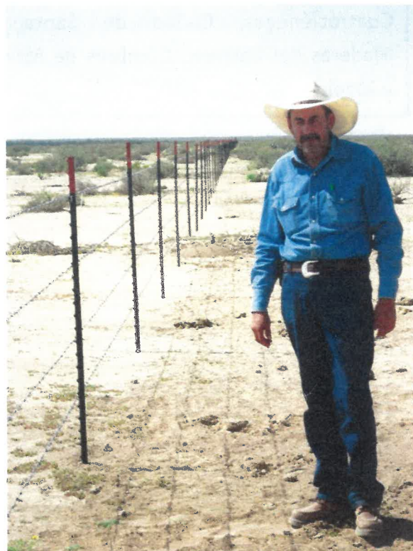
(Arriba) Cerco perimetral en Vicente Guerrero, Sierra Mojada, Coahuila. (Izq. Bordo semicircular de tierra en curva de nivel en NCPAG Tlahualilo, Dgo.