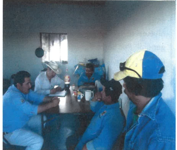
Formación de Comité en Colonia Ganadera Constitución, Sierra Mojada, Coahuila

Para fortalecer el programa en mención, se capacitará a las brigadas en el conocimiento de las especies de flora y fauna de la región que se encuentren bajo alguna categoría de riesgo de acuerdo a la NOM-059-SEMARNAT-2010, a su vez se impartirán técnicas de primeros auxilios y se elaborará un plan de acción para realizar las labores de vigilancia correspondientes.