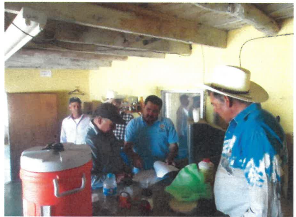
Integración de Comité de vigilancia de San José de los Álamos,