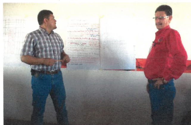
Imágenes .Consejeros presentan en plenaria los resultados de la planeación estratégica

Estas son las principales propuestas realizadas durante la reunión en cuestión: